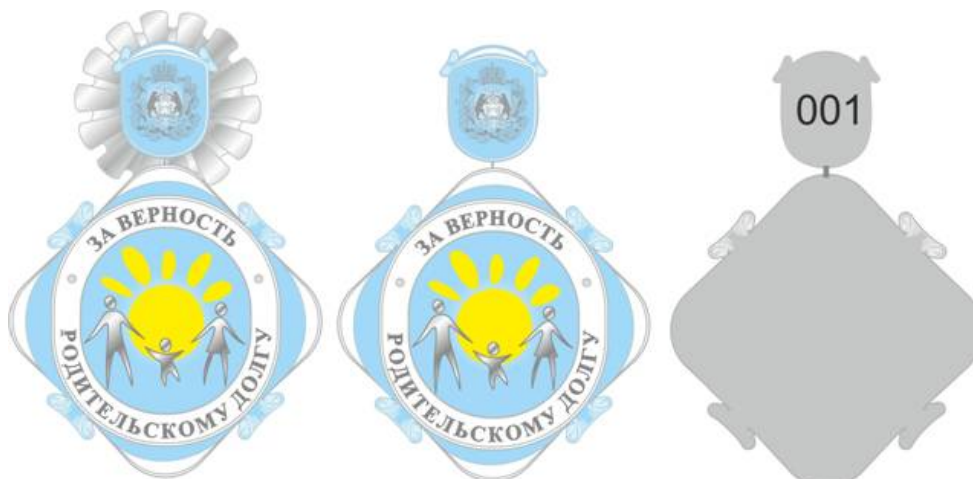
Для награждения матери

Почетный знак находится в бархатном футляре синего цвета с индивидуальным ложементом для вложения Почетного знака и удостоверения. Ложемент синего цвета изготавливается по форме футляра под изделие. Размер футляра 155 × 145 мм (внешний вид).